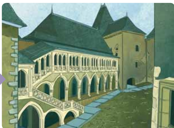
A XIX. századi Steindl-loggia