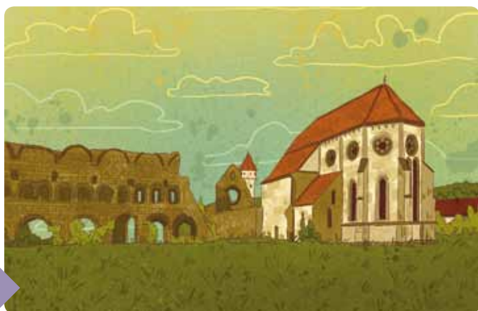
▲▲▲ Ciszterci apátság, Kerc

A francia cisztercita szerzeteseket II. Géza király hívta meg Magyarországra. Legnagyobb pártfogójuk III. Béla király, Erdélybe Imre király telepítette őket. Az Olt partján, Kercen építik fel ciszterci apátságukat. Tatárok, törökök, havasalföldiek pusztították. A templomot később a szász evangélikusok használták. A kolostor romjai közül a régi háromhajós templom homlokzatának rózsablaka, rozettája, és a később épült torony dacol az idővel. Árnyékukban érezhetjük a szerzetesi élet hangulatát, és a kódexmásoló műhelyre emlékezhetünk, ahol mindennapos foglalkozás volt az írás-másolás.