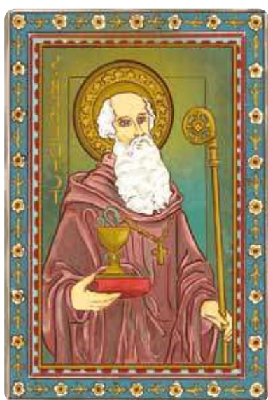
▲▲▲ Szent Benedek

Ím, milyen szerzetesrendek lakták ezeket a helyeket!