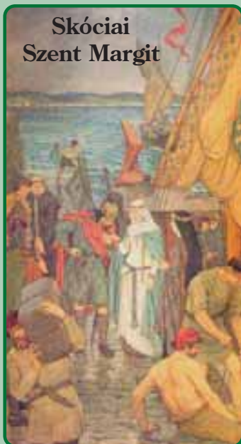
Skóciai Szent Margit

■ Szent László királyunk a vitézség, lovagiasság, rendíthetetlen hit és tiszta erkölcs jelképe, Erdély védőszentje.