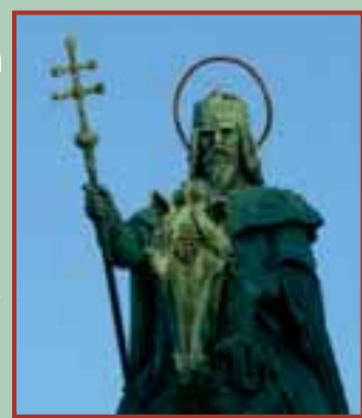
Első királyunk, Szent István országot épített, törvényt alkotott

■ Emese álma. A turul nemzetség, az Emese méhéből fakadt Árpád-házi uralkodók sora Álmos fejedelemmel kezdődött 830 körül, és III. András királlyal szakadt meg 1301-ben. A táblázat segítségével kövessük végig a nemzedékek rendjét. A fejedelmek, királyok nevét pirossal írtuk.