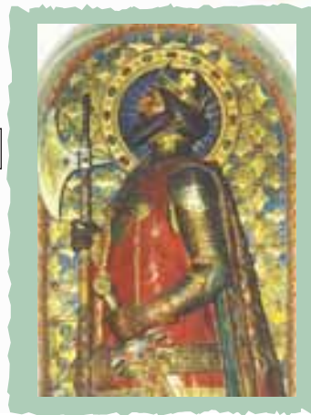
Szent László lovagkirályt páncélban, csatabárddal, az igazság Istentől kapott fegyverével ábrázolják