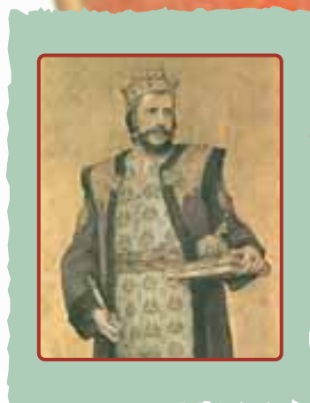
Könyves Kálmán korában csak a papok tudtak írni. Ő „tudományával minden más ország uralkodóját felülmúlta”