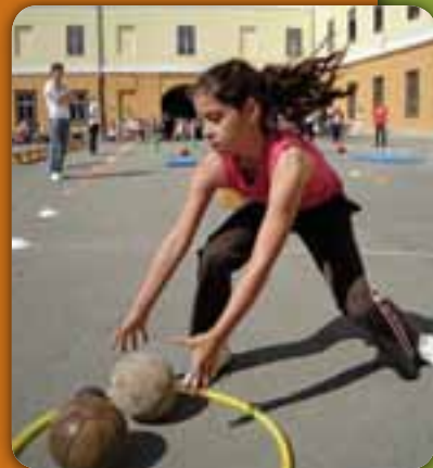
Staféta a Napsugár öttusán

Manapság minél fejlettebb egy ország gazdasága, annál hozzáférhetőbb a sport az emberek számára – akár nézőként, akár amatőr művelőként.