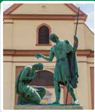
Szent Márton kútja Szombathelyen. Itt keresztelte meg édesanyját

Galliába visszatérve a keresztény hit sugárzó hatású terjesztője lett. Remeteéletet élt, mégis sereglettek köréje a tanítványok. Ő alapította az első kolostorokat Európában, Ligugében, majd Marmoutier-ben. Szerénysége és csodatettei miatt az egyszerű emberek körében egyre népszerűbb, a fényűzést és jólétet választó egyházi