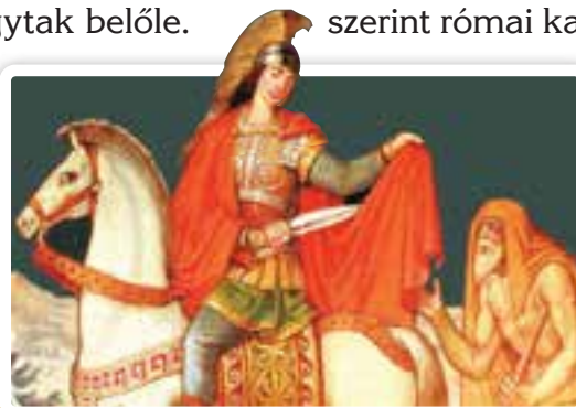
Szent Márton megosztja köpenyét a koldussal

Legismertebb legendája szerint társaival hóban-fagyban Amiens város kapuja felé lovagolt, amikor