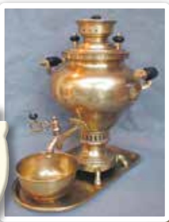
Szamovár, az oroszok teafőző edénye