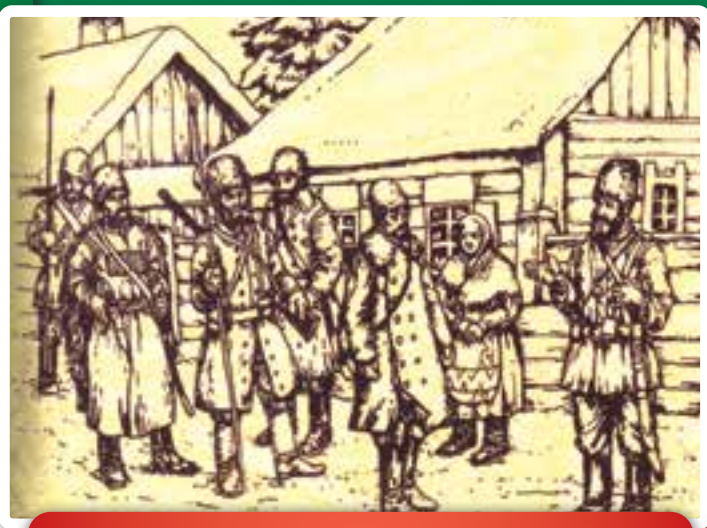
Akasszátok fel a királyokat! – írta Petőfi. Ki volt akkoriban Magyarország királya?

Végre eljött a szerencsés alkalom. Édesapja épp a városba indult, hogy a kilyukadt szamovárt elvigye Petrovicsnak javítani, de az egyik csikójuk elkószált, a kere-