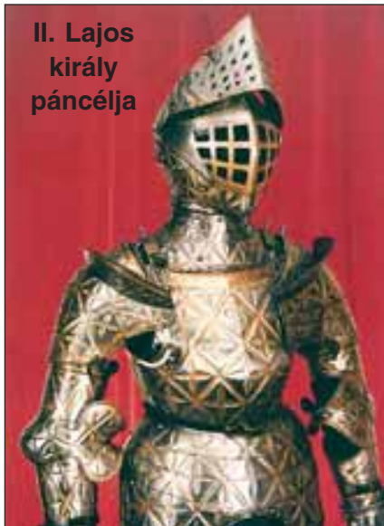
II. Lajos király páncélja