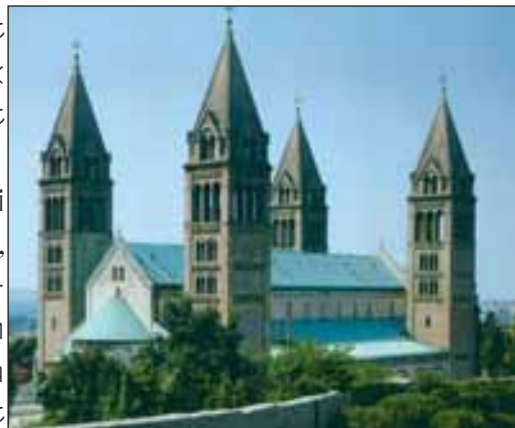
A pécsi székesegyház

A Mecsek ékszere Pécs – 2000 éves város. A római időkben Sophianae néven Pannonia egyik fővárosa, később fontos keresztény központ lett. Már az V. században 5 keresztény temploma volt. Szent István püspökséget és várat építtetett itt. Megkezdték a hatalmas székesegyház építését is, mely 800 év alatt