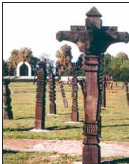
Emlékhely a mohácsi csata színhelyén

Több is veszett Mohácsnál – mondja azóta is a közmondás a szörnyű vereségre utalva.