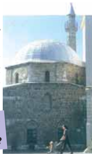
Hogy hívják a török imatornyot?

A város 150 évig török kézen volt. Magyarország legnagyobb török templomát, Gázi Kaszim pasa dzsámiját mára keresztény templommá alakították át. A dzsámi mellett álló toronyból naponta ötször hívta imára a híveket a müezzín (a mohamedán pap).