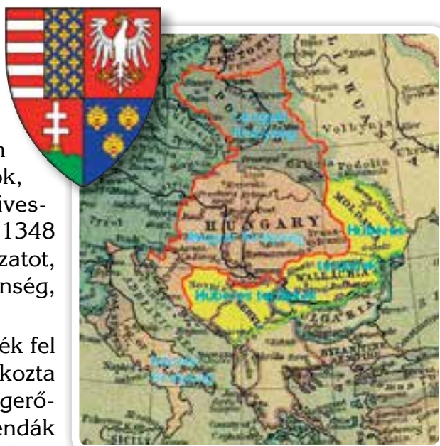
Nagy Lajos királysága

I. Lajost gondos, igényes neveléssel készítették fel a királyságra, a Jóisten is gazdagon megajándékozta uralkodói talentumokkal, ám nagyságának legerősebb pillére a hit és az áldozatvállalás volt. Legendák egész sora őrzi lelki nemességének példáit. Igazi lovagkirály volt.