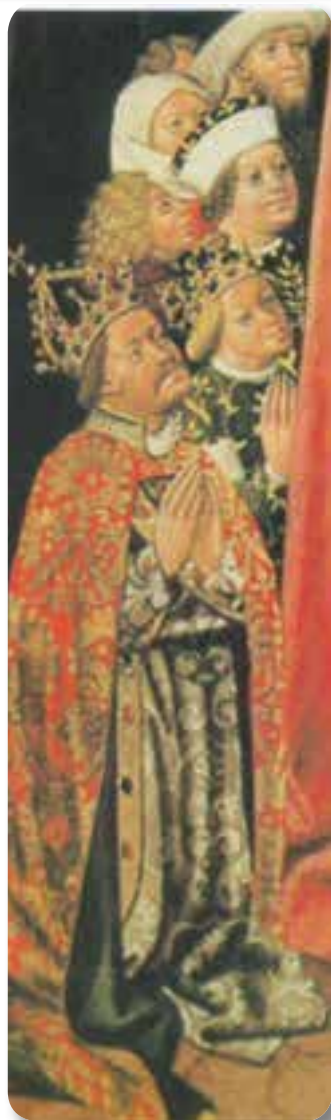
Habsburg Albert és Luxemburgi Erzsébet

Luxemburgi Zsigmond, magyar király és német-római császár – fia nem lévén – vejére, Habsburg Albertre hagyta a trónt. Albert két év múlva meghalt, ám Zsigmond leánya, Erzsébet már szíve alatt hordta a kis trónörököszt. A magyar nemesek egyik része őket támogatta, a másik párt úgy vélte, hogy a növekvő török veszélyben egy csecsemő (és ráadásul Habsburg) királlyal elvesz az ország, ezért a lengyel Ulászlót hívta meg a trónra. Erzsébet királyné ellopatta a magyar koronát, és kéthónapos fiát V. László néven megkoronáztatta. Ulászló hívei sem voltak restek: egy alkalmi koronával őt is királlyá avatták. Így lett két királya Magyarországnak.