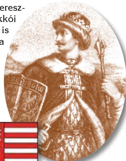
I. Ulászló magyar király

Hedvig mindössze 25 éves volt, amikor gyermeke születésekor a kicsivel együtt elhunyt. Férjének későbbi gyermeke szintén Jagelló Ulászló néven lengyel, majd magyar király lett, pedig ősei közt senki sem volt magyar.