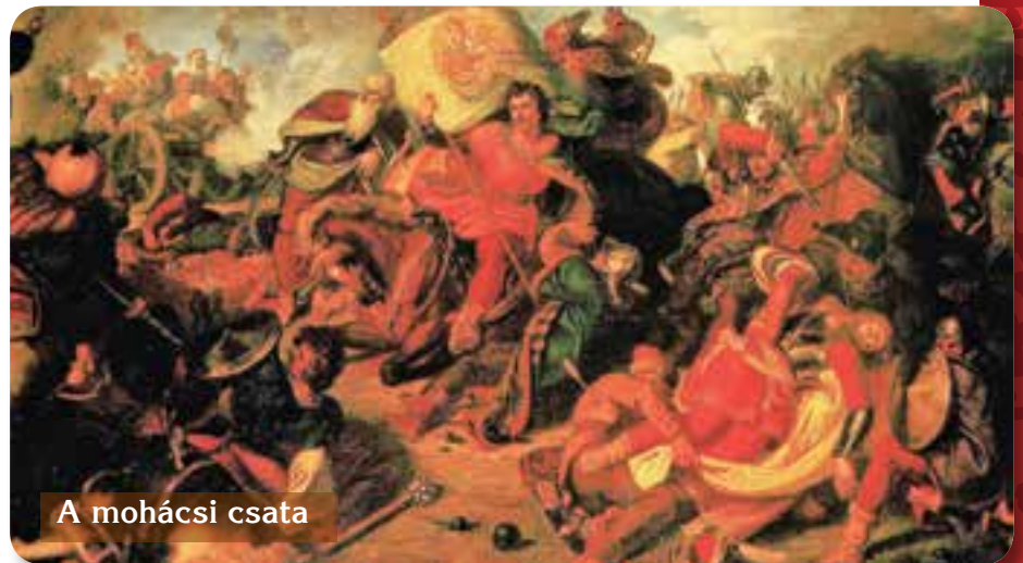
A mohácsi csata