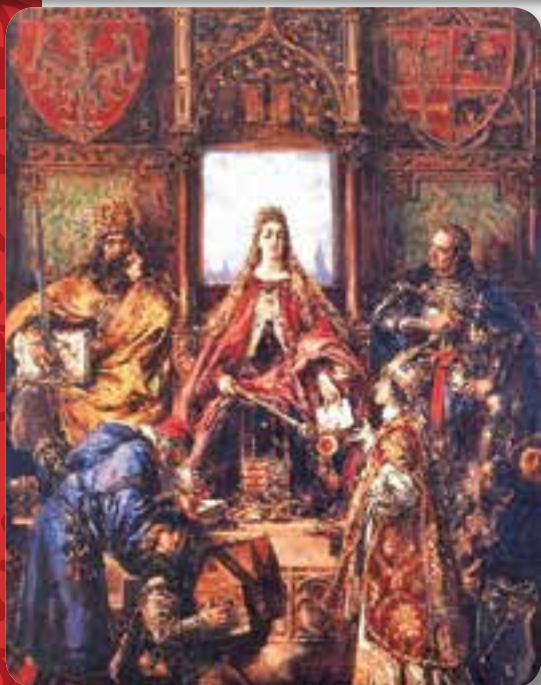
Hedvig – Jadwiga, a krakkói egyetem alapítója

Hedvig sokat tett a litvánok keresztény hitre térítéséért, a krakkói egyetemért. Templomokat is építtetett. A lengyelek Jadwiga néven szentként tisztelik.