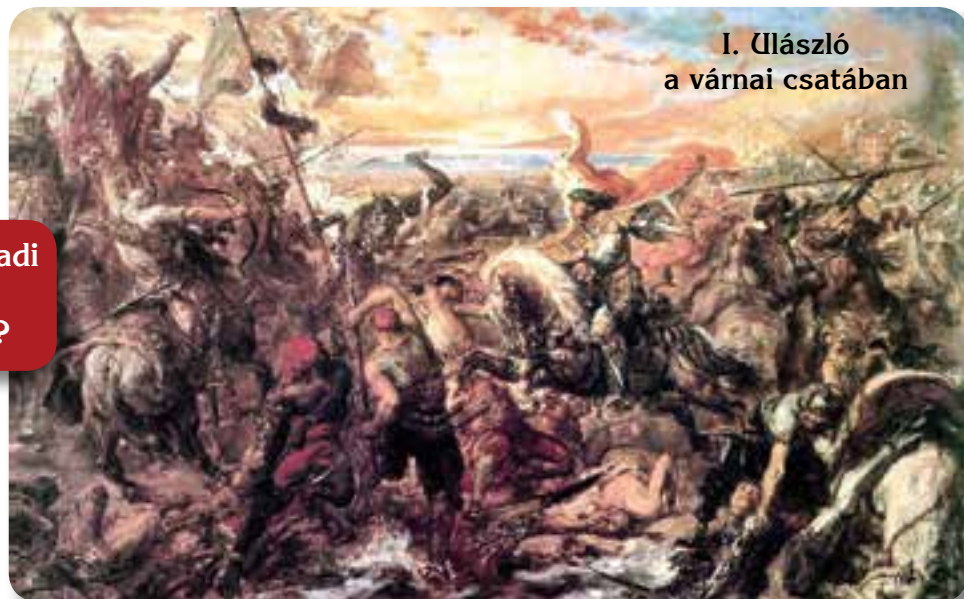
I. Ulászló a várnai csatában

Áldatlan belháború kezdődött: Luxemburgi Erzsébet és fia, V. László oldalán a Cillei és a Garai család, I. Ulászló táborában a kor legtehetségesebb hadvezére, Hunyadi János és leggazdagabb főura, Újlaki Miklós szállt hadba. A belviszályt a külső veszély döntötte el. Ulászló király és Hunyadi János a török ellen indult. Jelentős győzelmek után, 1444-ben, a várnai csatában súlyos vereséget szenvedtek. Elesett maga a király is. Várna két legnagyobb sugárútja ma Ulászló, illetve Hunyadi János nevét viseli.