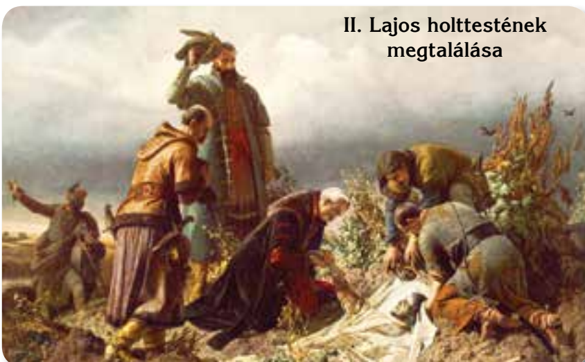
II. Lajos holttestének megtalálása