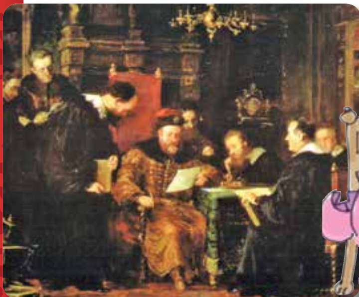
Bethlen Gábor tudósai körében

Melyek a nemesfémek? Hol vannak Erdély legnagyobb nemesfém, illetve sóbányái?