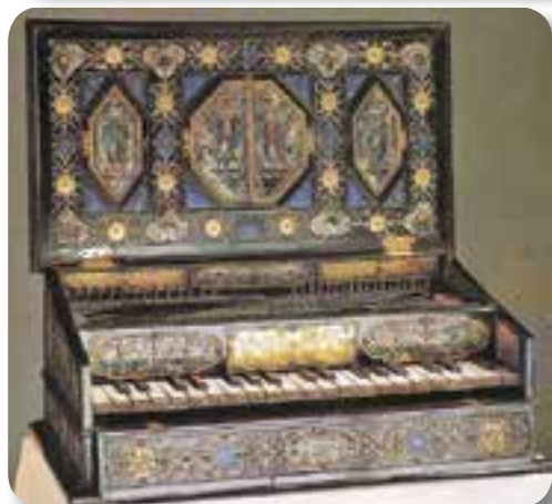
Virginál – Brandenburgi Katalin kis zongorája

Előre két lépés, meg vissza három, Kettő kelet, kettő nyugat felé: Az ördögökkel kellett cimborálni Látszattól néha, – mindig Istenért! (Reményik Sándor)