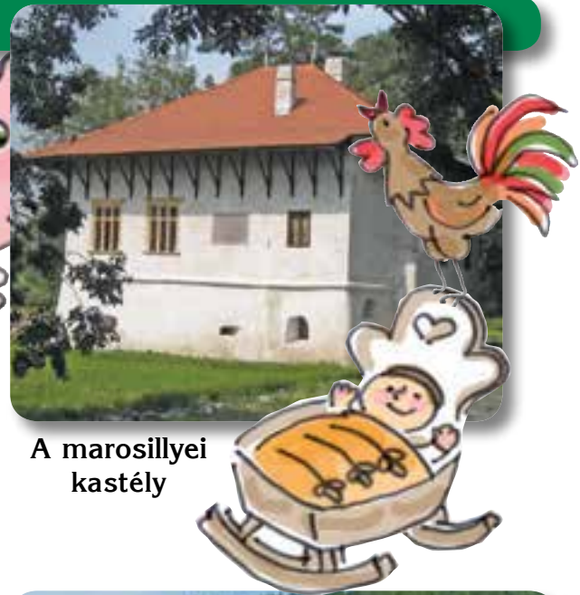
A marosillyei kastély

Gábort és öccsét, Istvánt mind korán elhunyt apjuk, mind felnevelő nagybátyjuk katonai pályára szánta, ezért a latin és az elméleti tudományok helyett inkább katonai és gyakorlati ismereteket szereztek. Miután Báthory Zsigmond elvette az árváktól a marosillyei birtokot, nagybátyjuk, Lázár András gyergyószárhegyi kastélyában nevelkedtek. Ekkoriban még Bethlen Gábornak is az volt a legvakmerőbb álma, hogy apród legyen a fejedelmi udvarban.