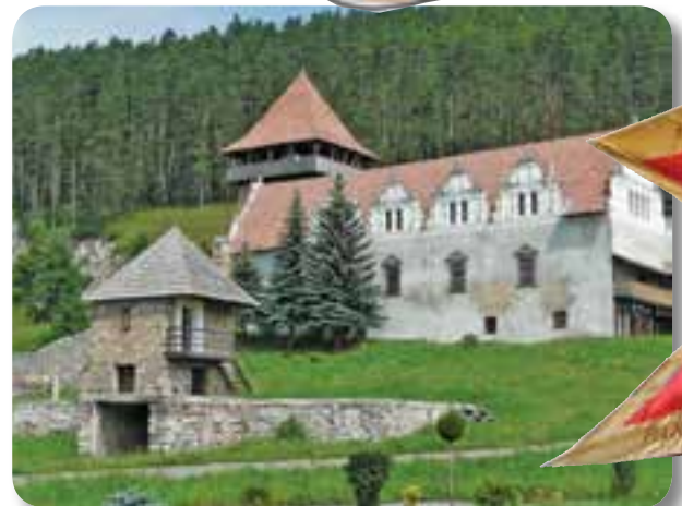
A gyergyószárhegyi Lázár-kastély