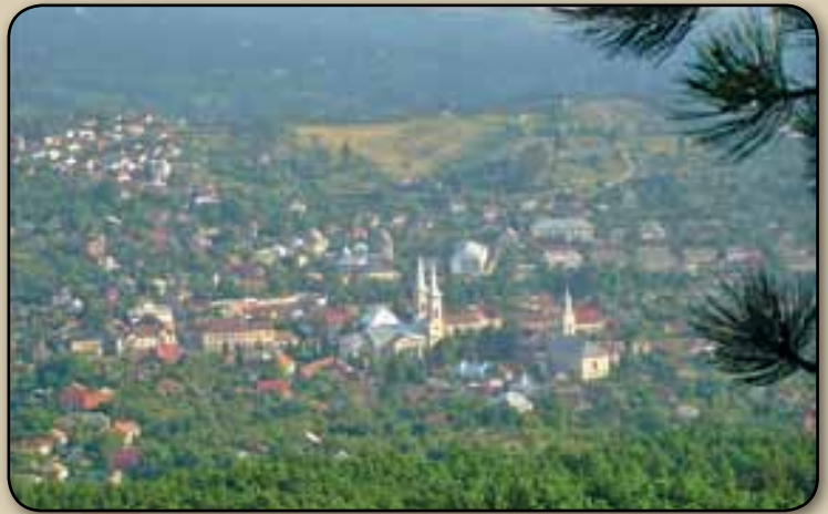
A város a Bányahegyről