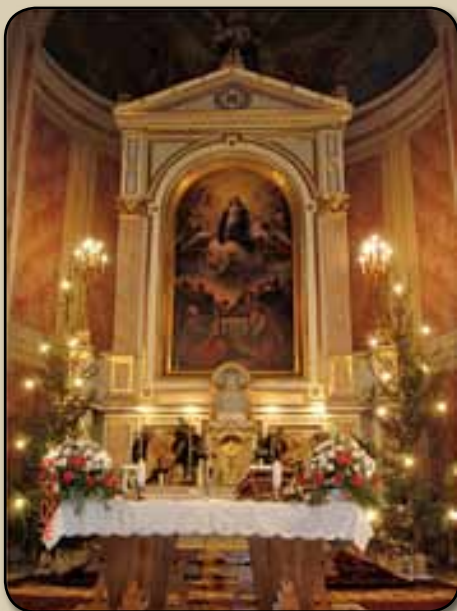
A katolikus templom belseje

Felsőbánya Románia északi részén, az ukrán határral szomszédos Máramaros megyében van. Nagybányától 10 km-re, keletre fekszik. Északról és keletről magas hegyek veszik körül, Somoshegy 600 m, Rozsály 1300 m, Bányahegy 729 m, Gutin 1447 m, Feketehegy 1200 m és a Hegyeshegy 625 m. A déli oldalon dombok határolják, nyugaton Giródtótfalu. A város főutcája a Zazar patakkal párhuzamosan halad.