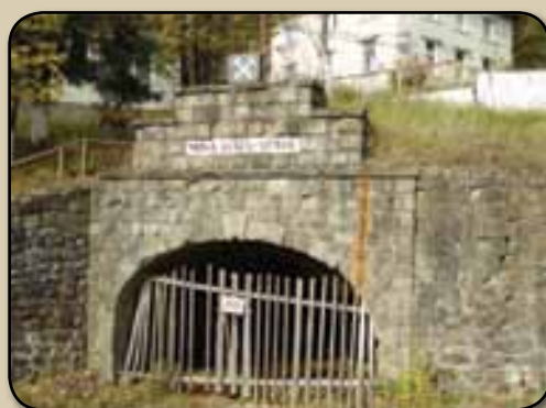
A bezárt bánya bejárata

Ha erre jártok, nézzetek be hozzánk, gyönyörű vidék ez, sok a látnivaló minden évszakban!