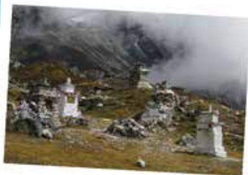
Temető az eltűnt hegymászók emlékére. Segíts, Istenem!