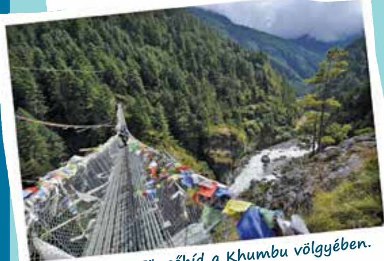
Ne nézz le! Függhíd a Khumbu völgyében.