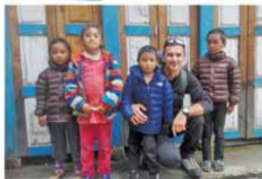
A tibeti gyerekek metsző hidegben is papucsban szaladgálnak.