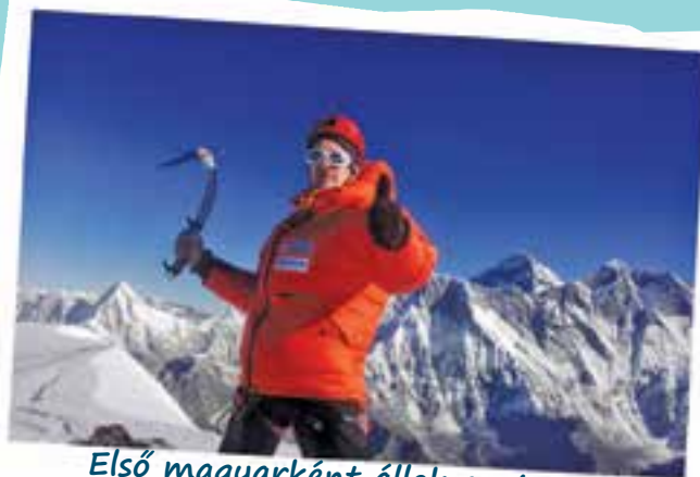
Első magyarként állok az Ama Dablam csúcsán. Sikerült!

Megmászta a Himalája egyik legnehezebb csúcsát. Nehéz küzdelem volt, és életreszóló élmény. Szükség volt hozzá minden erőmre és tudásomra. Bölcsebben, tapasztaltabban tértem haza, tanultam hibáimból is. Találkozunk a következő csúcson!