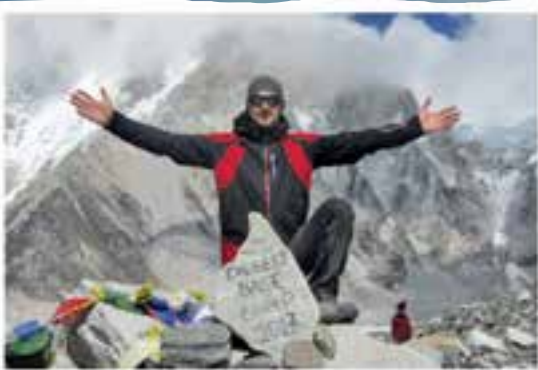
Alaptábor az égbenyúló csúcsok lábánál. Felkészülni, kész, rajt!