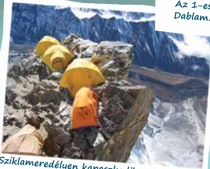
Sziklameredélyen kapaszkodik a 2-es tábor. Szédültök?