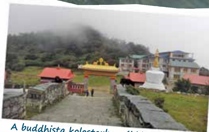
A buddhista kolostorban áldást kaptam további utamhoz.