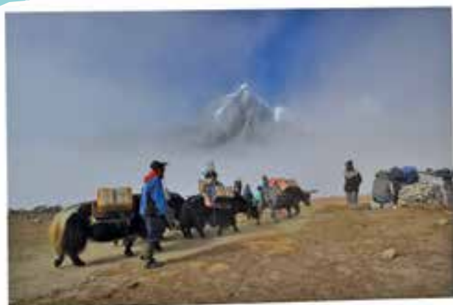
A nyaktörő ösvényeken jakok cipelik a terhet.