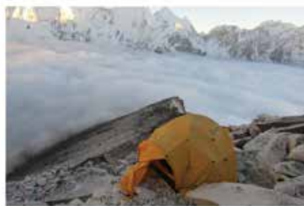
Sziklára lépjek vagy felhőre?