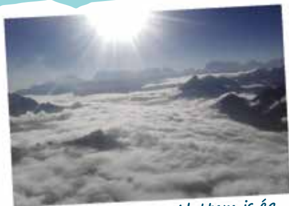
6000 m magasan. Alattam is ég, fölöttem is ég. Lent fellegek, fent szikrázó napkorong.