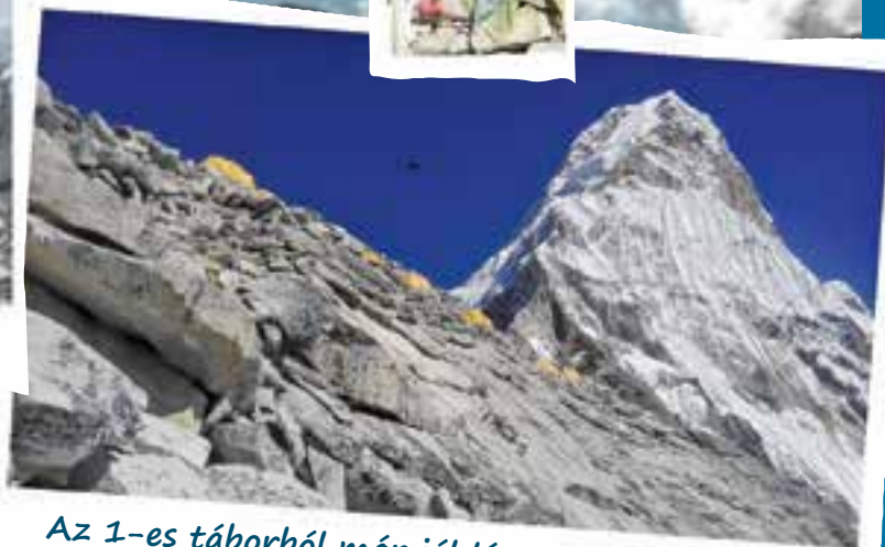
Az 1-es táborból már jól látszik céloim, az Ama Dablam. A „jégnyakláncos anya” szinte hívogat.