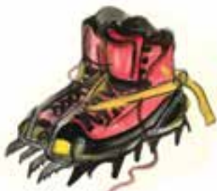
Bakancs és hágóvas

Vágjátok ki a bélyeget, és ragasszátok nevetek mellé az osztály közös gyűjtőlapjára.