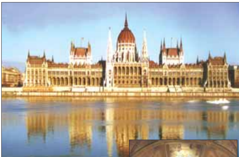
Az Országház a Duna felől illetve a díszlépcső

A pesti oldal sok szép palotája közül az Országház a legismeretebb. Építéséhez a Kárpát-medencei Magyarország minden tartománya hozzájárult: a faanyagot a Székelyföld adta, a márványt Biharban bányászták, a kőcsipkét kalotaszegi kőfaragók készítették. Festmények, szobrok, arany, márvány és kristály – az 1906-ban elkészült csodálatos Parlamentből irányítják az országot, itt tartják a legdíszesebb ünnepeket, amikor tudósokat, írókat, művészeket, sportolókat tüntet ki az államfő.