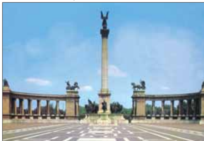
A Millenniumi Emlékmű

Budapest legjelentősebb útvonala az Andrassy út, amely a belvárost köti össze a Városligettel. Alatta halad Európa legrégebb földalatti vasútja. Ezen suhanunk ki a sok látnivalót nyújtó Ligetbe. A Hősök tere első látványossága a Millenniumi Emlékmű, mely a honfoglalás 1000 éves évfordulójára készült. A szoborcsoport Árpádot és a hét honfoglaló vezért ábrázolja. Az árkádok alól történelmünk nagyjai néznek ránk.