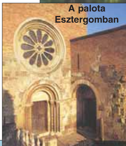
A palota Esztergomban

Esztergom, Magyarország első fővárosa Géza fejedelem idején épült. A Duna fölé ugró sziklán, a Várhegyen már a X. században fejedelmi palota állt, melyet később bővítettek, szépítették, és 250 évig Árpád-házi királyaink szálláshelye volt. Itt született, és tartotta esküvőjét a német Gizella hercegnővel Szent István királyunk.