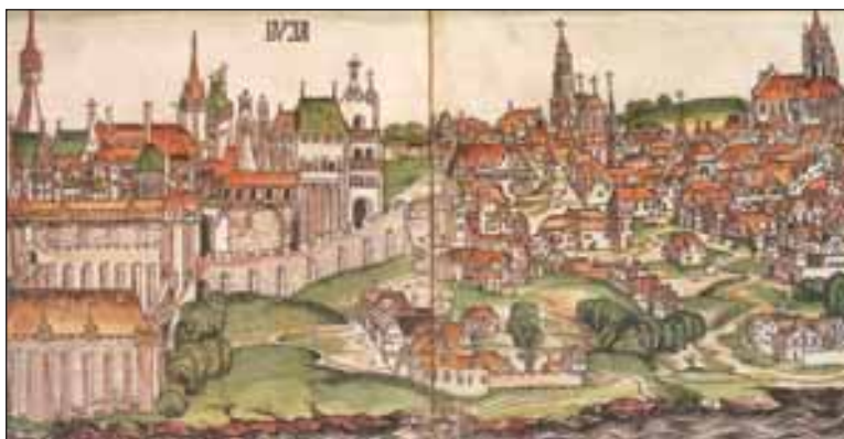
Buda vára Mátyás korában

Hová tették a gyertyát a középkori írnokok?