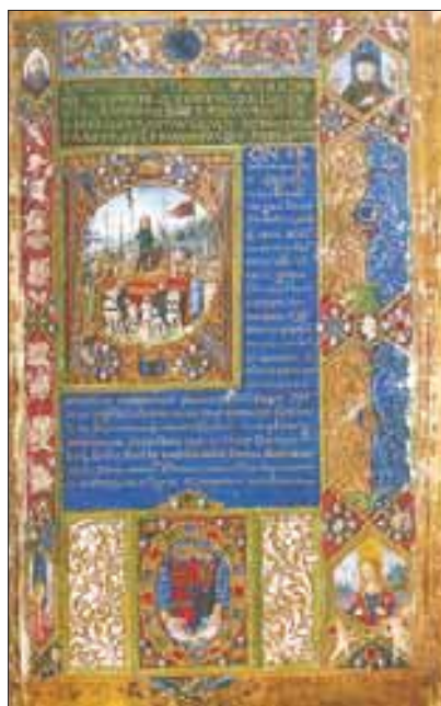
Festett oldal és iniciálé egy corvinából

Egyik könyv gyönyörűbb, mint a másik. Minden lapjuk gondosan kifestett, a kezdőbetűk színesek; néha egész képet festett a művész egy-egy kezdőbetű köré. Ezt latinosan iniciálénak nevezik. Némelyik könyv többre kerül, mint három falu. Mátyás király többet költ könyvekre, mint bárki más a mostan élő uralkodók közül. A könyveket részben selyembársonyba, részben dúsan aranyozott, sötétvörös vagy fekete kecskebőrbe kötik.