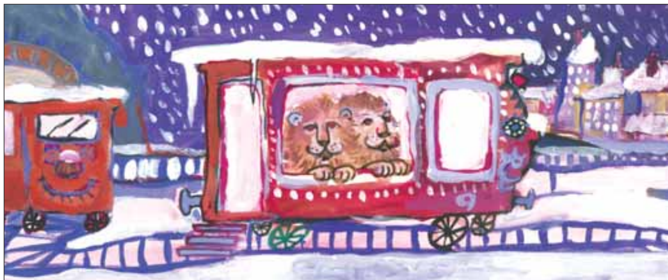
TOMOS TÜNDE rajza

– Köszönjük a jókívánásokat, mi is kelle-