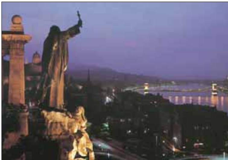
Szent Gellért püspök szobra

A Várhegy szomszédságában álló hegyet Gellért püspökről nevezték el, aki István király tanácsadója, Imre herceg nevelője volt, és akit 1046-ban a lázadó magyarok hordóba zárva innen gurítottak le a Dunába.