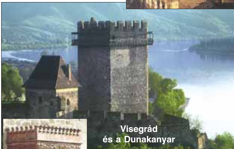
Visegrád és a Dunakanyar

Magyarország legnagyobb temploma, az esztergomi főszékesegyház (bazilika) a XIX. században épült. Hatalmas kupolájából a Dunán közlekedő sétahajók kis papírcsónaknak tűnnek.