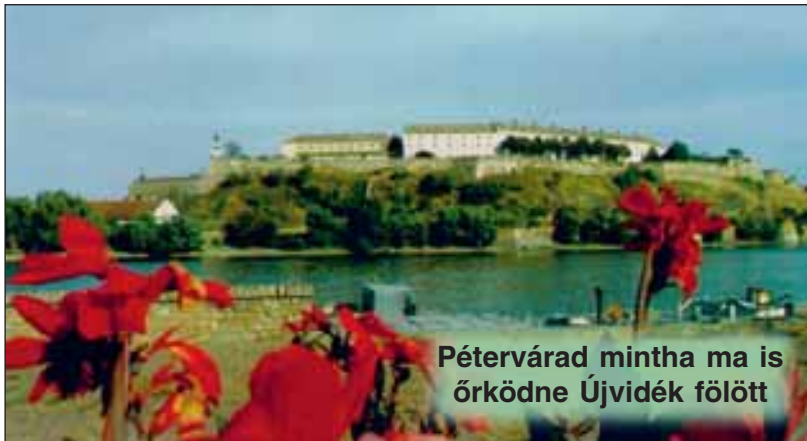
Pétervárad mintha ma is örködné Újvidék fölött