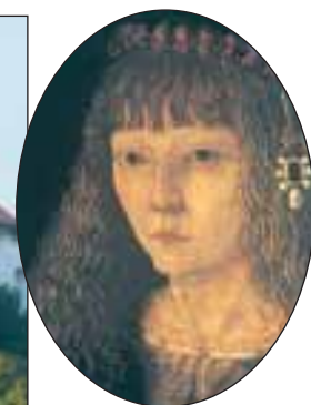
Mátyás király fia, Corvin János

Varasd a Hunyadiak birtoka volt. Mátyás király halála után fia, Corvin János birtokolta a vidéket, és itt is halt meg.