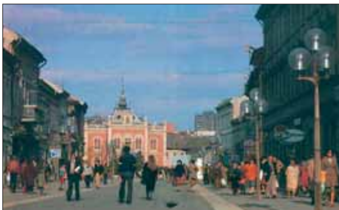
Fontos oktatási, művelődési központ Újvidék (Novi Sad) is.

Szabadka híres szülőtte Kosztolányi Dezső . Ismeritek A játék című versét?