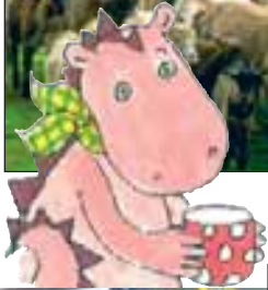
Kóstoltatok már édes kecsketejet?