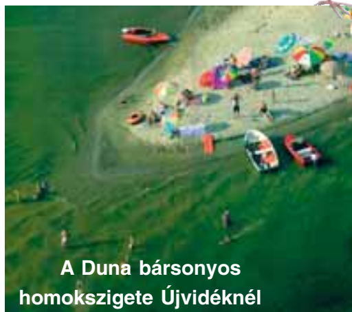
A Duna bársonyos homokszigete Újvidéknél