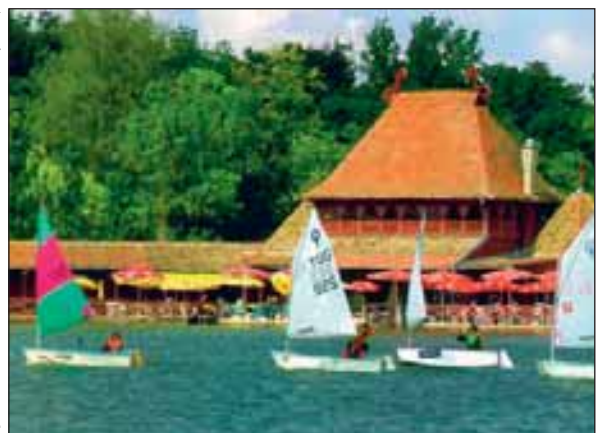
Palics régi híres fürdőhely, ma is csalogatja a sportolni, pihenni vágyókat

– Medvevájamban? – tűnődik el egy pillanatra: – Nem is tudtam, hogy van Medvevájam. Majd megnézzük. De előbb jóllakunk málnával.