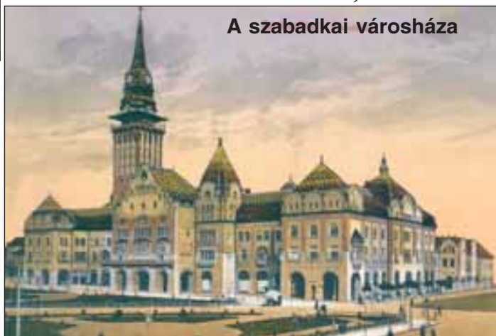
A szabadkai városháza

Szerbia Vajdaságnak is nevezett tartományában 250.000 magyar él. Szabadka városát IV. Béla királyunk alapította a tatárjárás után, majd Hunyadi János innen irányította a déli határok védelmét. A XIX. század második felében a város gyors fejlődésnek indult, Magyarország déli központja lett. Ekkor épült a ma is működő színház, az elegáns városháza, amelyet Zsolnay kerámia díszít gazdagon. Fényűző termeiben ma is pezsgő művelődési élet zajlik.