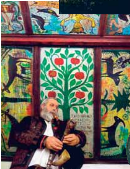
Aki dudás akar lenni... Délvidékre is mehet tanulni.