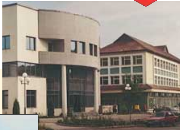
A bank épülete

A mai Zsibó központja város kinézetű. Két új tömbháznegyedében működik általános iskola, de magyar tagozat csak az 1-es Általános Iskolában van.