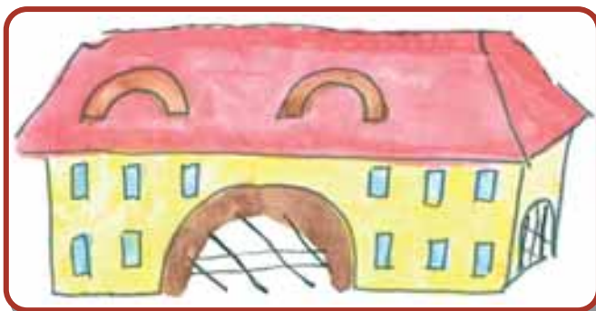
A „Fejedelmek háza” ma múzeum

Már a rómaiak is sőt bányásztak, és várost építettek itt Potaissa néven. Később országgyűlések, híres vásárok és mesterek városa lett Torda.