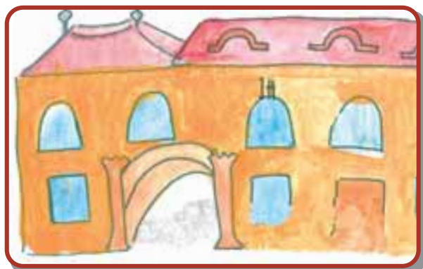
A Wesselényi ház. Itt született báró Jósika Miklós, az első magyar regényíró.

A főtéri katolikus templomban tartott 1568-as országgyűlés Európában először törvénybe iktatta a vallásszabadságot.