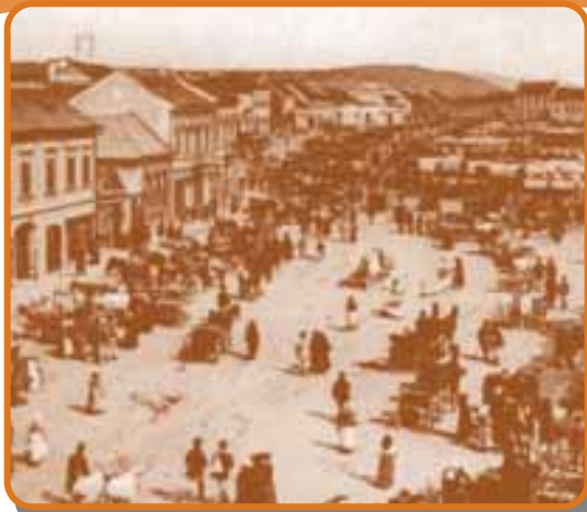
Vásár Régen főterén a két világháború között

Hajdan a céhmester beiktatása és a céhláda átadása ünnep volt. Felvonulást szerveztek, melynek élén virágokkal és szalagokkal díszített fehér ruhás inasok és segédek haladtak. A mészároslegények szép, kövér, aranyozott szarvú ökröt vezettek fel. A tímárok szimbóluma egy ló volt, melyet azonban imitáltak: pokróccal leterített céhbeliek játszották meg. A csizmadiák jelképe féllábú ember volt, a kovácsok élén páncélruhába öltöztetett vasember, a szűcsök élén medvebőrbe bújt férfi haladt. Azoknak a házaknak az ablakait, ahol este a táncot rendezték, kitömött rókákkal, nyulakkal, nyestekkel, mókusokkal díszítették fel.