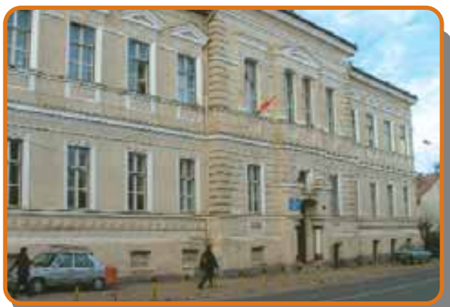
Iskolánk Augustin Maior nevét viseli.

Messze földön híresek voltak bútor- és hangszerkészítőink. Ez a hagyomány ma is él, ezért Szászrégent a hegedűk városának is nevezik. De volt Régennek fűrészgárára, bőrgyára, szeszgyára, fémpipara és több malma is. A gazdasági felemeléssel járó jólét kihatott a város művelődési életére. Olvasóköri, fűvös- és vonózenekarok, dalegyletek és sportversenyek tették színessé a békeidőket.