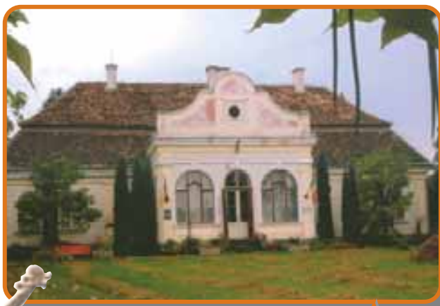
A néprajzi múzeum

A mai főter volt a hajdani nagy vásárok helyszíne. Régent szorgos iparosok, kereskedők, szász, magyar, román, zsidó, roma közösségek lakták. Az azonos mesterséget űző iparosok érdekvédelmi szervezetei, a céhek a XVI. századtól a XIX. század végéig szervezték, irányították Szászrégen lüktető gazdasági életét. Egy 1749-ben készített összeírás szerint a városban tizenhét céh létezett 202 mesterrel. Közülük a tímárok, a csizmadiák, a kádárok és a szűcsök céhe volt a legnagyobb.