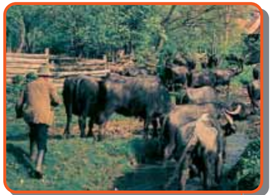
Gyertek, kóstoljátok meg a bivalytejet!

Az állatokat nem hajtják haza naponta, hanem maga a gazda megy ki fejni a legelőre. A bivalycsordát csak szeptember végén, október elején hajtják be a faluba.