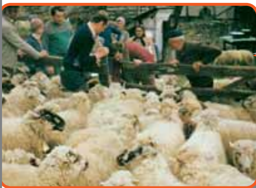
Vidám ünnep a juhmérés

Szeretettel várunk május utolsó szombatvasárnapján a Mérai Napokra, ahol a felsoroltakról személyesen is meggyőződhetek.