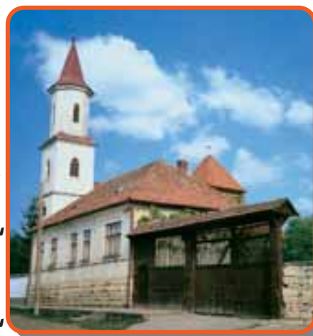
A református templom