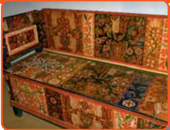
A tájház egyik kincse

Sötétben minden tehen fekete – tartja a közmondás. De nálunk az egész csorda fekete nappal is, hiszen a legtöbb család bivalyot tart. A bivaly kevesebb, de tartalmasabb tejet ad, mint a tehen. Van is keletje a kolozsvári piacon a mérai bivalytejnek, vajnak.