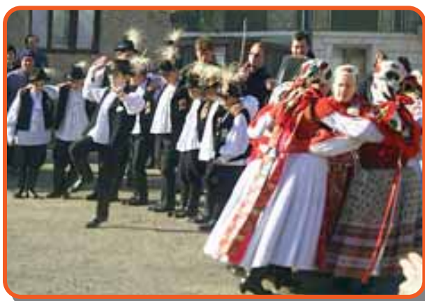
Dobban a csizma, suhog a szoknya a mérai utcán

Kirándulóhelyeink: Várhegy, Ördögárok (szikladarabok), Hétölesfa, medvési kaszáló, homokbányák.