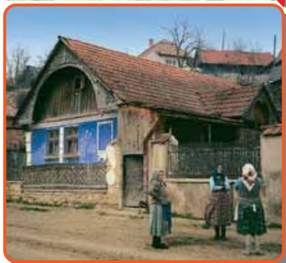
Pávafarkas, „naphomlokú” ház Mérában

Kincses Kolozsvártól északnyugatra 12 km-re található Méra , Kalotaszeg egyik legjellegzetesebb faluja. XIII.