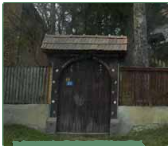
A templom tulipános kapuja

■ A középkorban katolikus falu a reformáció idején református lett a templommal együtt.