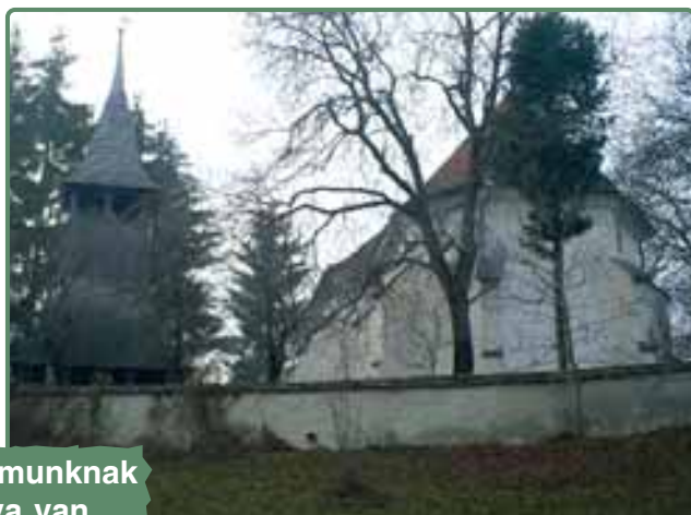
670 éves templomunknak különálló fatornya van

■ A gótikus templomot kökerítés veszi körül, és különálló fatornya van. Orbán Balázs egy Zsigmond király korabeli harangról is számot ad, mely már nem létezik: „oldalát király, királyné, szentek és jelképes alakok domborművei” díszítették.