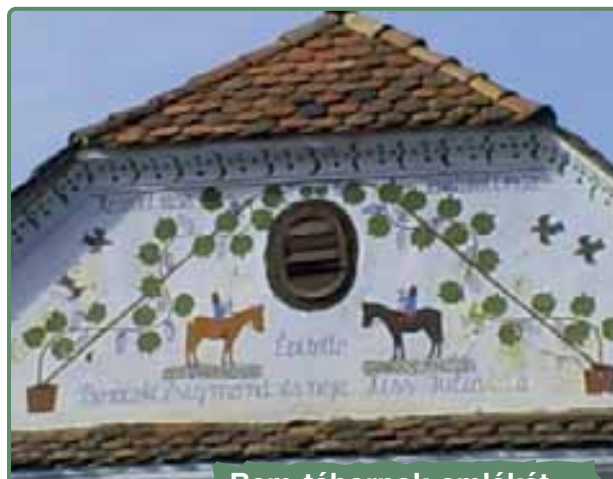
Bem tábornok emlékét Küsmödön is őrzik