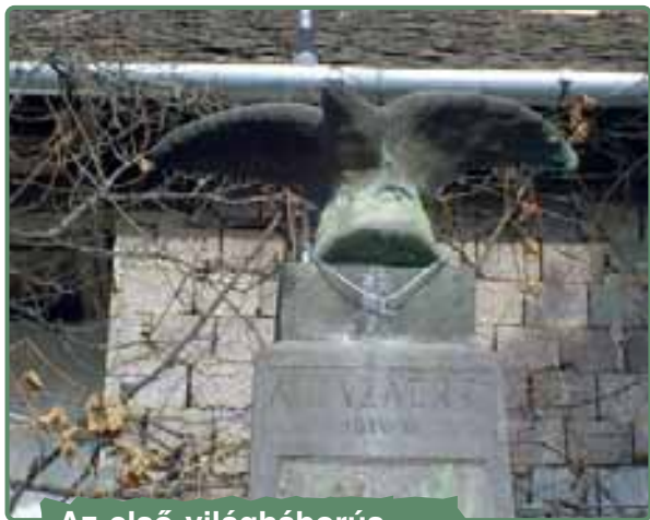
Az első világháborús hősök emlékműve

■ 1567-ben az összeírás alapján a falu 308 lakossal rendelkezett. 2002-ben lakossága 423 főből állt: 304 székely magyar, 119 roma.