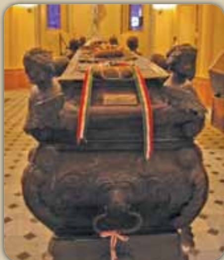
A Károlyi család kriptája

Kaplony a Partiumban, Románia északnyugati részén, Szatmár megye területén, a hajdani Ecsedi láp szélén terül el. Szülőfalunk szépségét nem természeti adottságainak, hanem lakói szorgalmának köszönheti.