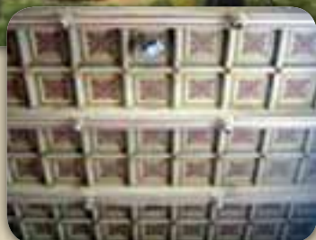
A hazahívó kettős torony és a kassettás mennyezet