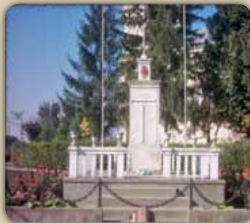
A világháborús emlékmű