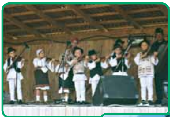
A kis muzsikások a gyimesi napokon

1990-ben a szülők kérésére három iskolában újraindult a magyar oktatás. Mára a buhai iskolában újra megszűnt a magyar osztály. A mi iskolánknak hagyományörző ének- és táncsoportja van. A neve Gyimesi vadvirágok. Osztályunkból is sokan tagjai vagyunk. Új informatika termünk számítógépeit ajándékba kaptuk a budapesti Fenyves utcai Iskolától és az Erdélyi Magyarok Törökbálinti Egyesületétől.