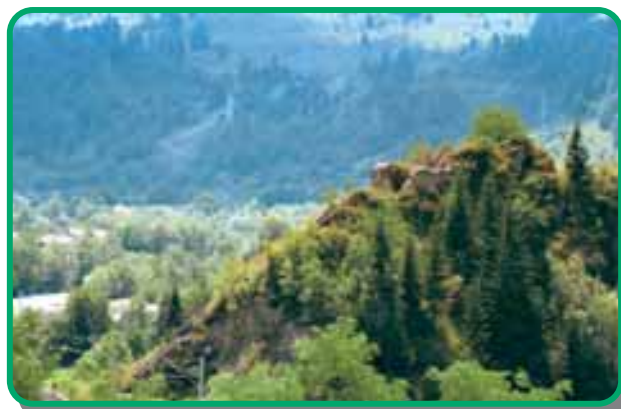
A Rákóczi-vár romjai

Gyimesbük zord, hegyes vidék. 700-1000 méterrel emelkedik a tengerszint fölé. A népdal is azt tartja: „A gyimesi hegyek kőből vannak rakva”. A zordságot erdők, kaszálók és a patakok völgyében megbúvó takaros házak élénkítik.