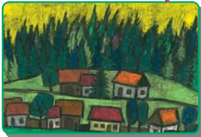
Főcze Alpár rajza

Gyimesbüköt magyarok és románok lakják. Az itt élő magyarokat csángóknak nevezik. Őseik a katonai szolgálat elöl vagy lázadásuk miatt az osztrák katonaságtól üldözve csángáltak el szülőföldjükről, és húzódtak az őserdők borította havasok közé. Másik hagyomány szerint határőrök voltak, és nevük a vészharang csengésére utal.