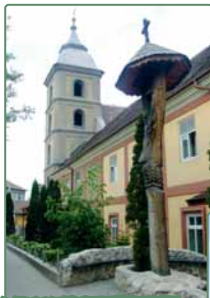
A Magyarok Nagyasszonya Kollégium

■ A mi iskolánk, a Téglás Gábor Iskolaközpont 2005 szeptemberében nyitotta meg kapuit, csak magyar gyerekek tanulnak itt. Az I–IV osztályos gyerekek egy része a Magyarok Nagyasszonya Kollégium épületébe jár, amelyet a Szent Ferenc Alapítvány működtet.