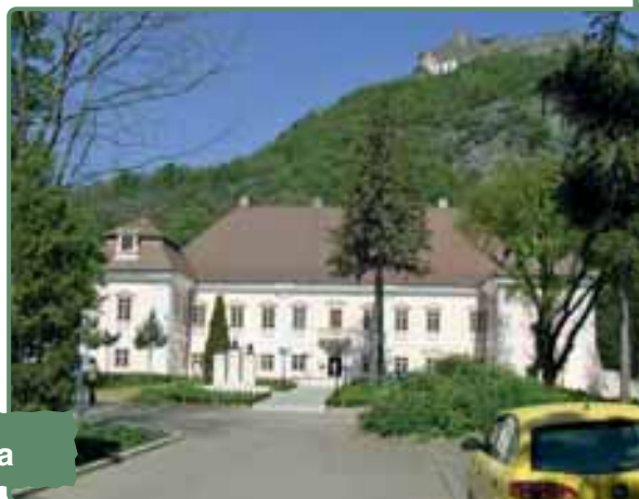
A Magna Kúria

■ A vár alatti völgyben helyezkedik el a késő reneszánsz stílusban épült Magna Kúria. A kastélyt Bethlen Gábor építtette. Napjainkban történelmi múzeumnak ad otthont.