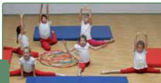
Mi is szeretünk tornászni

■ Az első magyar iskolát Geszthy Ferenc várkapitánynak köszönheti a város, aki a XVI. század elején úgy rendelkezett, hogy vagyonából iskolát alapítsanak Déván.