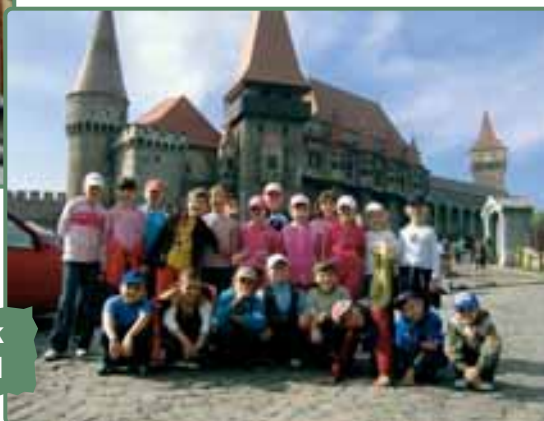
Lovagok Hunyad váránál

■ Tőlünk pár kilométerre Piskin még ma is áll annak a hídnak néhány pillére, amely az 1848–49-es szabadságharc idején tanúja volt a magyar honvédek utolsó győzelmének. Szintén tőlünk nem messze, Marosillyén Bethlen Gábor szülőháza várja a látogatókat. Itt van a szomszédban Vajdahunyd, ahol Hunyadi János lovagvára nyújt felejthetetlen élményt a látogatóknak.