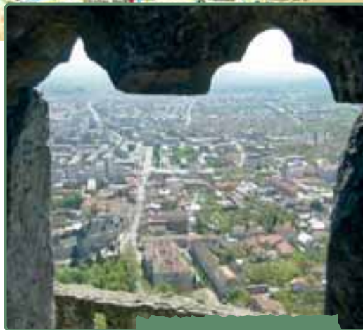
Látkép a várból