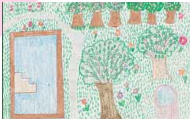
A Budyos-forrás és a medence.

Iskolánk 1876-ban épült "az unitáriusok buzgóságából". Az I–IV. osztályban 70 gyerek tanul, ebből 45 magyar nyelven.