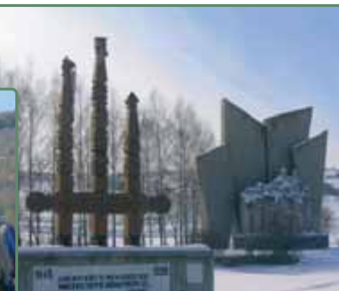
Az emlékműnél minden októberben megemlékezést tartanak