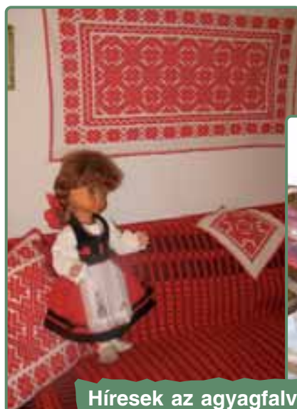
Híresek az agyagfalvi szőttesek

■ I-VIII. osztályos általános iskolánk 1992 óta Berzenczey László nevét viseli. Iskolánk vegyes kultúracsoportja és 1996-ban alakult fúvószenekara nagyobb ünnepekkor mindig szerepel.